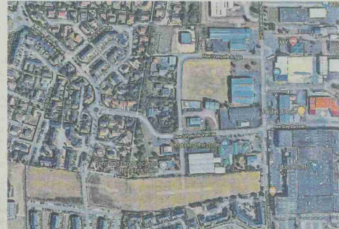
Finalement, à l'arrière du centre Leclerc, la réserve foncière (une partie de la bande marron sur cette capture d'écran) pour la construction éventuelle d'un équipement public, a été livrée.

Une seconde révision du Plan local d'urbanisme (PLU) a été confiée au cabinet Schneider. Le résultat a été présenté par un membre de ce cabinet, Danielle Sibaud.